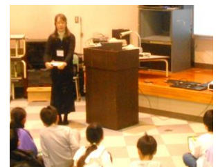
4年生講師 江別地域委員会スクールカウンセラー 学校心理士 ○○ ○○ 氏