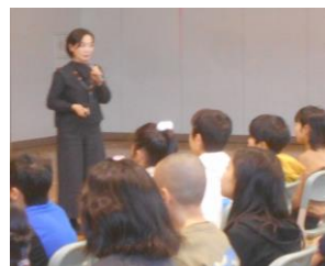
5・6年生講師 「子どもとメディア北海道」 事務局長 ○○ ○○ 氏

文京台小学校では、12月の参観日の際に外部講師を招いて4～6年生を対象に人間関係力や情報モラルに関する特設授業を実施し、保護者の方々にも一緒にお話を聞いていただきました。今後も学校とご家庭の両輪で子どもたちの健やかな成長を支えていきたいと考えています。